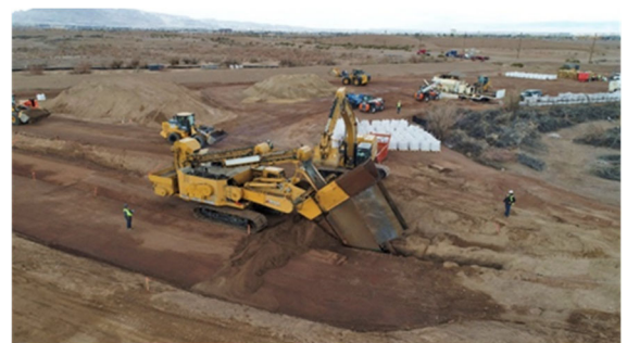
Instalación de Hierro Cero Valente para un estudio de tratabilidad de NERT

NERT está evaluando en el campo varias posibles tecnologías para la reducción de la contaminación del suelo y aguas subterráneas. Hasta la fecha, diez estudios se han completado o están en proceso. Los resultados preliminares han demostrado que ciertas tecnologías correctivas reducen drásticamente las concentraciones de contaminantes y previenen una mayor migración de contaminantes. Se anticipa completar los estudios en el 2024.